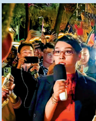
扮演知名歌手那英的網紅「這英」。

拿着指揮棒做好本職工作，卻經常要跟別人解釋：我這套不是cos！現在只出不進！拍視頻也好，要合照也好，大家都是遵紀守法的好市民，沒有擾亂秩序，熱熱鬧鬧地過着更適合中國人的萬聖節。