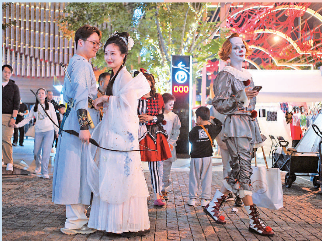
▲10月28日晚，上海市民身着各種「萬聖節」裝扮參加市集。