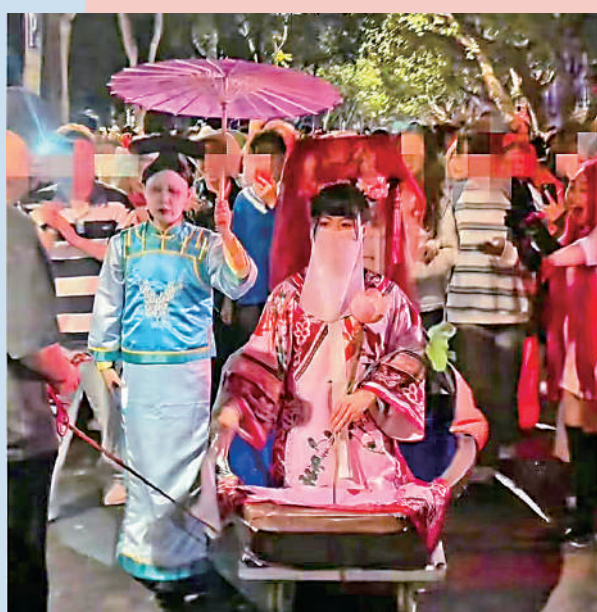
▲有市民扮演成電視劇《甄嬛傳》中的角色安陵容。