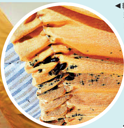
◀韓國啟明大學多間宿舍出現床蝨，圖為藏在床單內的床蝨。