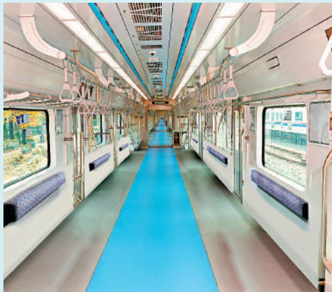
▲首爾地鐵計劃明年推出無座車廂。