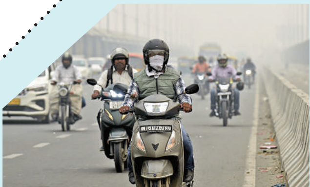
▲新德里日前再現嚴重霧霾天氣。