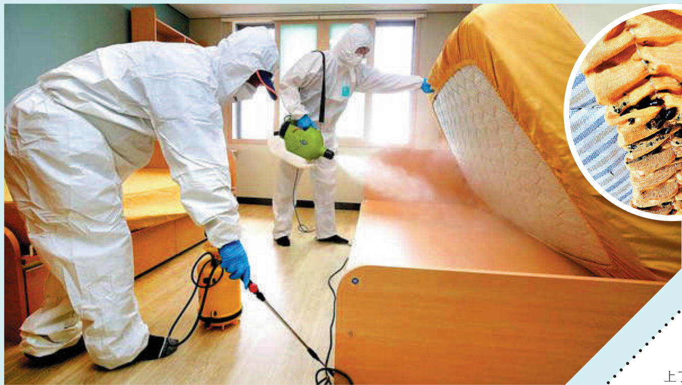
▲防疫人員在大邱啟明大學宿舍進行消毒。