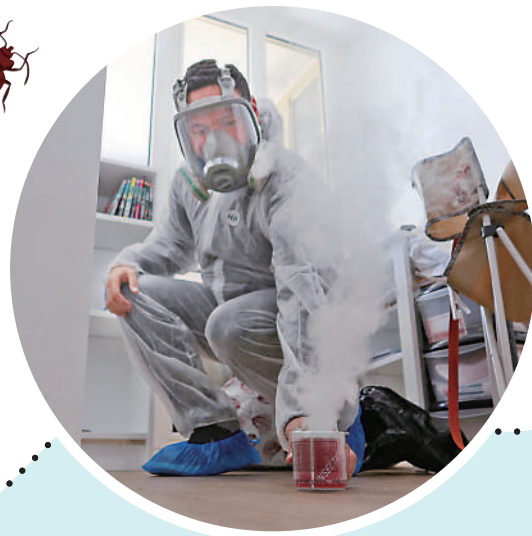
◀巴黎滅蟲服務人員在一間公寓進行滅蟲及預防工作。