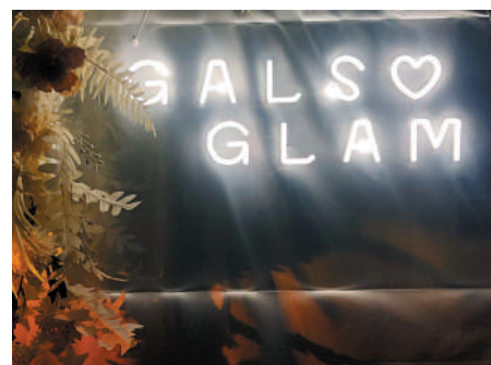
▲涉及「女悅醫美」美容中心感染群組人數已達15人。網上圖片

衛生防護中心昨日指出，除了早前公布的5名女子（年齡介乎26至53歲）懷疑感染膿腫分枝桿菌外，已透過個案追蹤聯絡了另外多名女士（年齡介乎23至37歲），她們曾到「女悅醫美」／「GALS GLAM BEAUTY」／「GALS GLAM」位於荔枝角兩個處所接受聲稱消脂注射服務，其後出現皮疹、硬塊或膿腫。全部病人情況穩定。