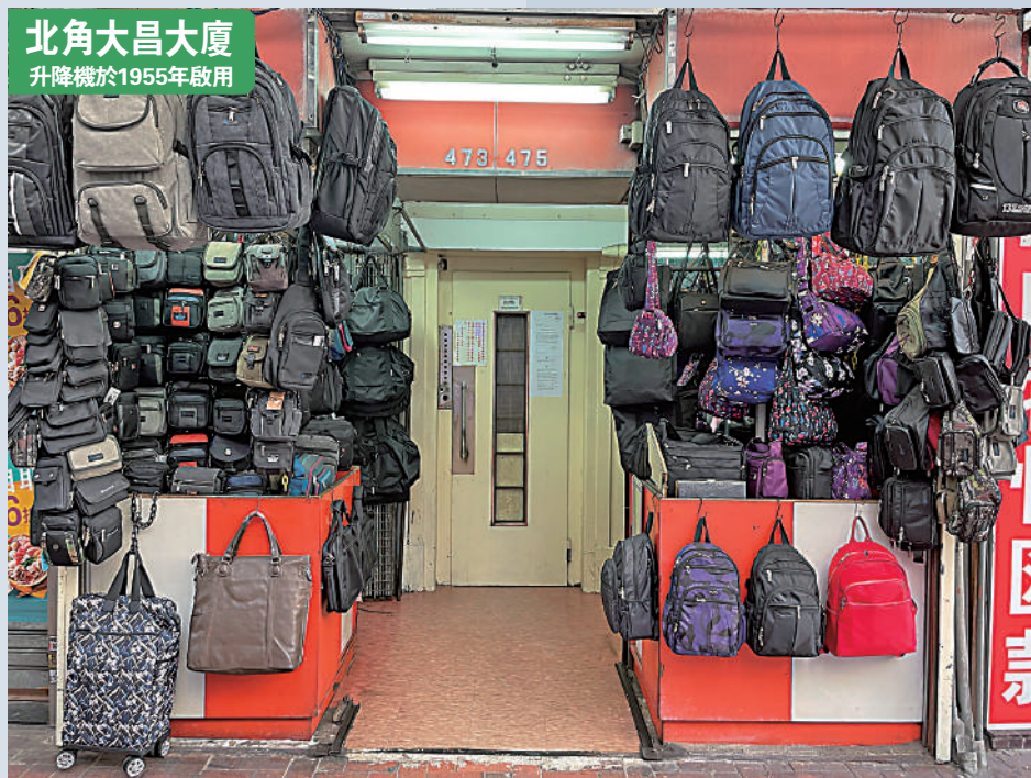
北角大昌大廈 升降機於1955年啟用