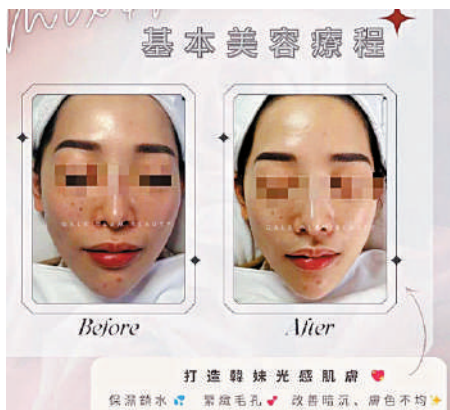
「女悅醫美」社交平台中，可提供多項美容服務。