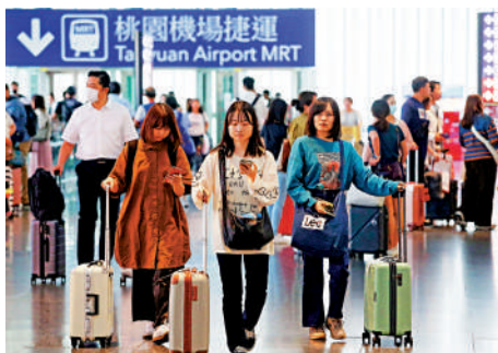
▲台當局3日宣布，旅行業者從明年3月1日起可組團到大陸旅遊。

【大公報訊】據中通社報道：台灣交通部門負責人王國材3日稱，台灣赴大陸旅遊團禁令將在明年春節前宣布解除，春節後3月1日起台灣旅行業者可組團到大陸及接待大陸旅遊團。