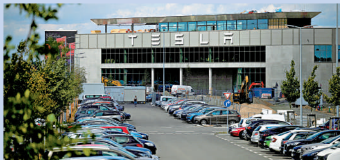
特斯拉位於德國勃蘭登堡州的電動汽車製造工廠。

在美國的外國汽車製造商平均勞動力成本為55美元/小時，而工會化工廠的平均成本為64美元/小時。特斯拉在美國的每小時勞動力成本估計在45美元到50美元之間。