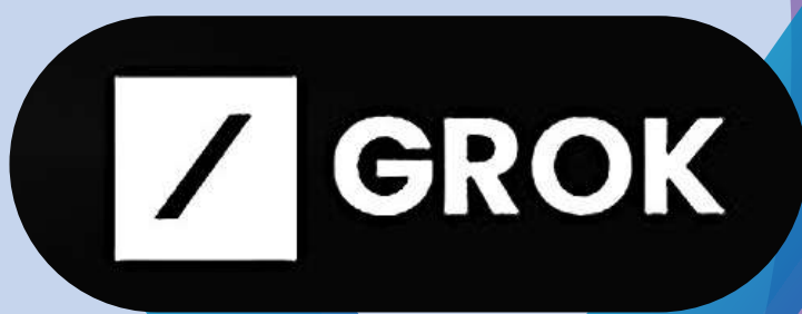
馬斯克宣布推出自家AI聊天機器人Grok。網絡圖片