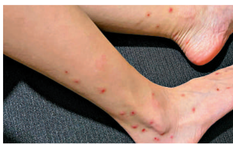
▲床蟲主要咬人的臉部、手臂、手和腿部等暴露位置，被咬後會出現紅腫癢痛。