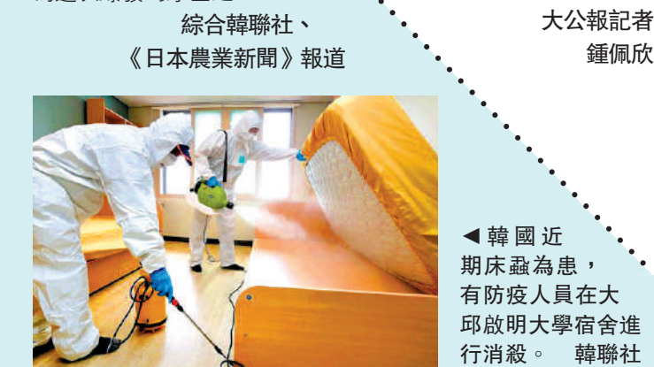
▲韓國近期床蟲為患，有防疫人員在大邱啟明大學宿舍進行消毒。