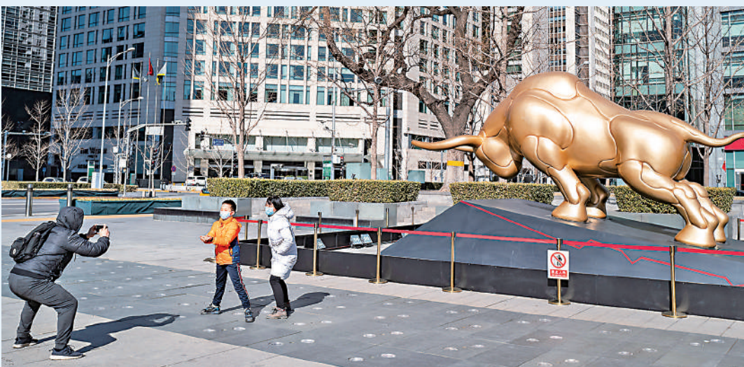
中央金融工作會議強調，堅持把防控風險作為金融工作的永恆主題。圖為北京金融街。

總體而言，從基本面、情緒面和季節性考量，做空美元將大概率成為下一個擁擠的交易。在「過度擁擠」前，美匯指數將會遭遇顯著的下行壓力。對於人民幣而言，外部環境的好轉也意味着其面臨的貶值壓力將會進一步被釋放。