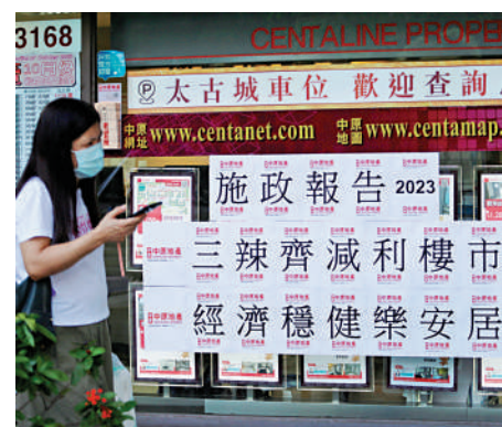
▲施政報告推出樓市「減辣」措施，有助帶動成交量上升。

目前整體市場暫時未有上升，但是出現了更多上車和換樓的機會，可以說「減辣」是初步得到成功。特區政府固然在「減辣」、增加土地和重視市場轉