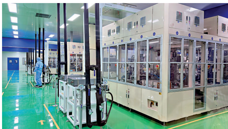
▲巨灣技研南沙總部基地自動化產線。