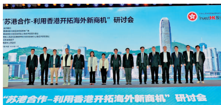
▲參加研討會的嘉賓合影留念。

【大公報訊】記者賀鵬飛南通報導：11月7日，「蘇港合作——利用香港開拓海外新商機」研討會在江蘇省南通市舉行，全球工程機械行業領先品牌徐工集團及內地知名餐飲品牌和府餐飲同時在會上披露，近期已在香港投資落戶。香港特區政府投資推廣署署長蔣蔣禮表示，僅今年前10個月，投資推廣署已協助333家來自內地及全球的企業落戶香港，同比增長30%以上。