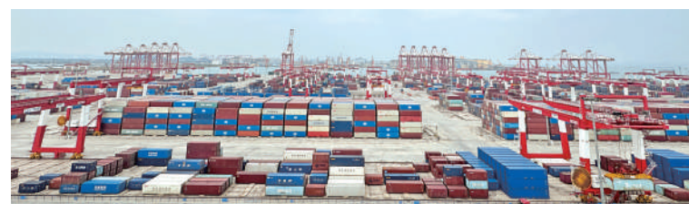
▲廣州港南沙港區四期碼頭，全自動化運作。