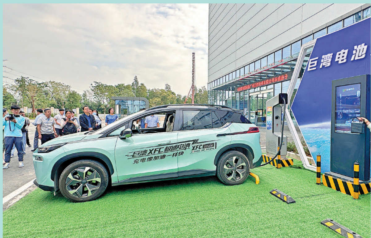
▲粵港澳大灣區建設集中採訪團記者現場見證超快充電電池的充電過程。