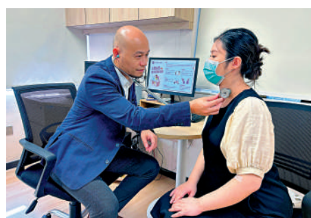
▲香港醫生在廣州「港澳居民健康服務中心」看診。

記者7日從第三屆粵港澳大灣區衛生健康合作大會新聞發布會上獲悉，廣州與香港、澳門開展醫療資源融合接軌取得