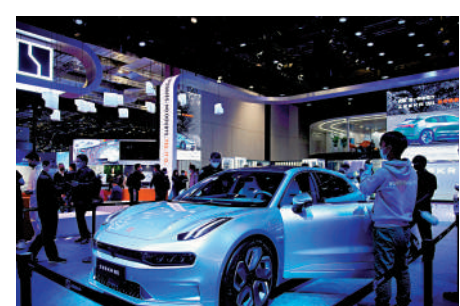
▲中國新能汽車產業近年高速發展。