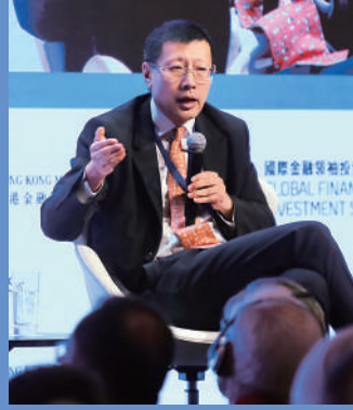
▲沈南鵬指香港可在大灣區發展中扮演更重要角色。