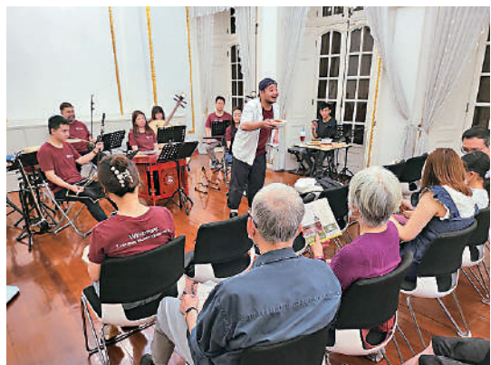
▲同樂日設有音樂匯演《爐峰彩雲詠孫文》。 ▲孫中山紀念館位於中環半山衛城道7號。 ▶博物館設有鑄幣機讓參加者製作紀念幣。