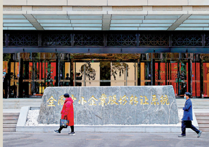
▲北京證券交易所預計年內分步推出信用債發行、承銷、上市交易等業務。