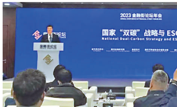
▲雷曜表示，加強可持續披露工作的數字化、標準化和智能化。

截至三季度末，中國ESG基金規模超過了5900億元，發行基金的數量接近500隻，全市場已有近六成的基金管理人發布了ESG基金產品。另外，綠色保險、綠色信託、綠色票據等其他綠色金融資產均取得快速的發展。