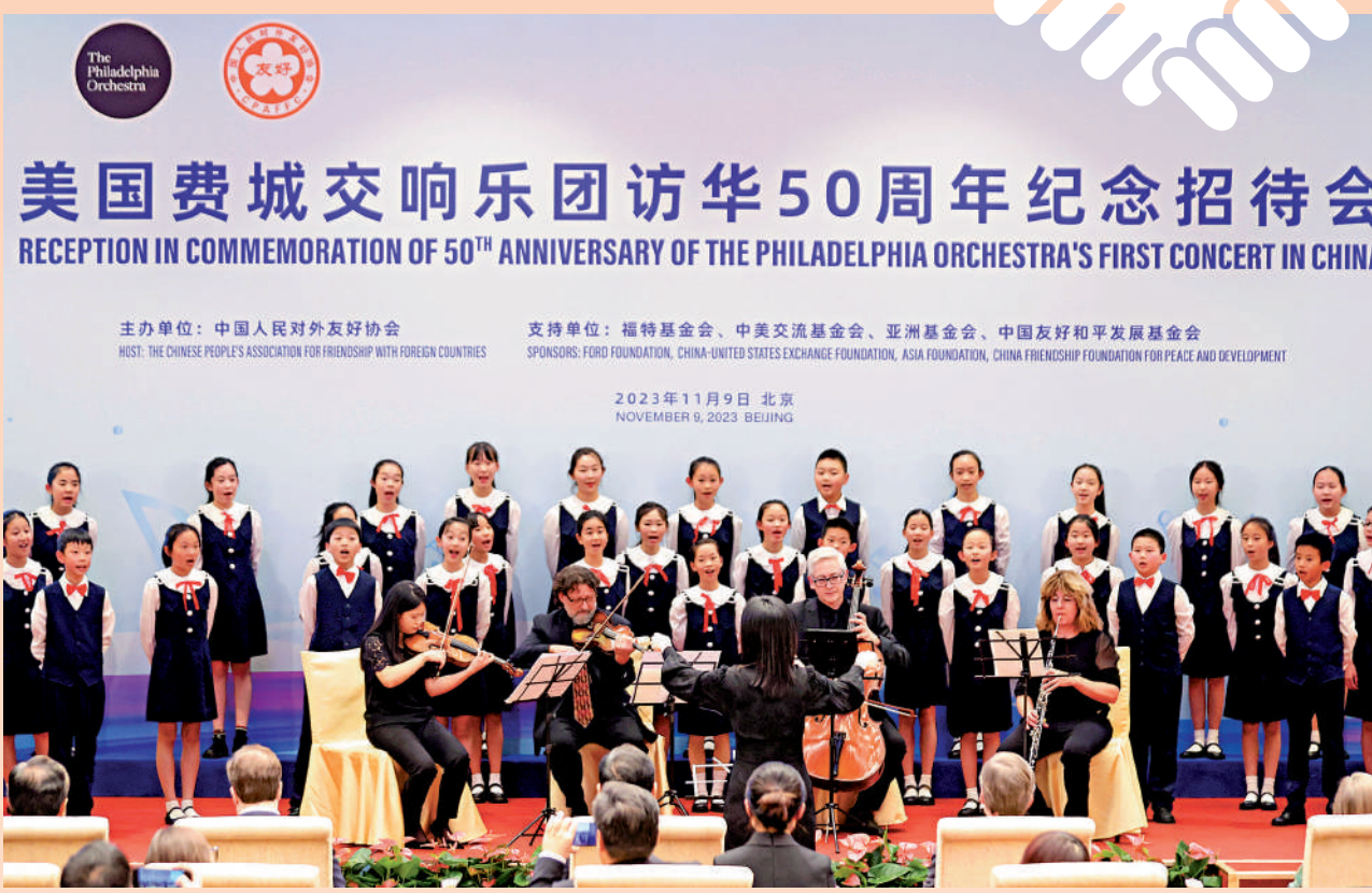
▲11月9日，美國費城交響樂團訪華50周年紀念招待會在北京舉行，近百位中美各界人士出席活動。圖為北京愛樂合唱團與費城交響樂團共同演繹《茉莉花》。

另一方面，兩個大國若能相向而行，對許多重大國際事務、全球性挑戰、地區熱點問題的協調解決，將產生極大的推進力，為世界秩序與公共治理注入確定性。這是當前極為稀缺而又迫切需要的。並且，中美元首會晤也將為對中國與其他西方國家關係走向，發揮不可忽視的風向標意義。這同樣關乎改善開放發展的外部環境。