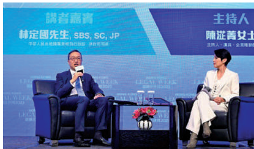
▲昨日活動設「國安聊天室」環節，林定國回應學生現場提問。

在另一個環節「藝術與法律之東西融合於香江」，論壇的嘉賓講者針對知識產權保護和交易、版權問題、有效解決文化藝術和創意產業之間的糾紛，以及網絡藝術市場監管等領域，闡述藝術與法律之間的相互關係，從而展示出香港的高質量法律服務和法律培訓就推動跨界別、跨領域的文創內容創作和知識產權交易、保護和推廣藝術的創造力和多樣性，以及文化藝術和創意產業發展至關重要。