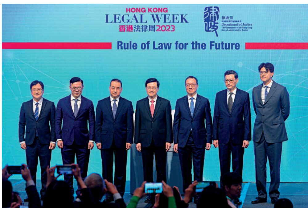
▲一連五天的香港法律周2023昨日舉行壓軸活動「『法』展未來」，李家超、劉光源等嘉賓合照。