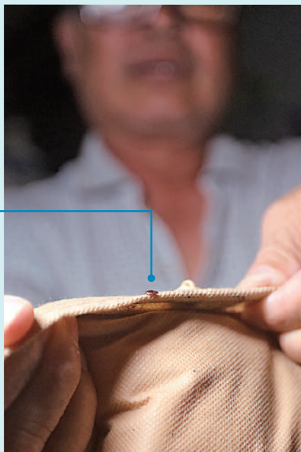
▲籠屋住戶隨手拿起枕頭，背面已看到床蟲蹤影。