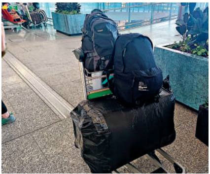
▲有市民外遊前用膠袋包住行李箱，避免床蟲藏匿。

平時經常需要搭機場快綫去博覽館的鄭女士向大公報記者表示，雖聽過新聞講床蟲，但覺得只要自己最近不外遊、注意衛生就問題不大。不過，在得知機場快綫座椅可能藏匿床