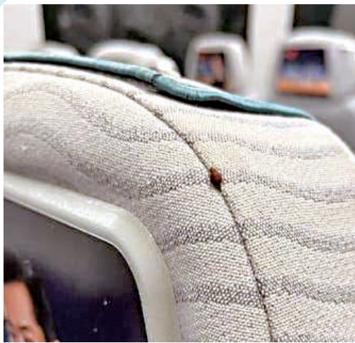
▲網上流傳一張在機場快綫列車上發現床蟲的圖片。