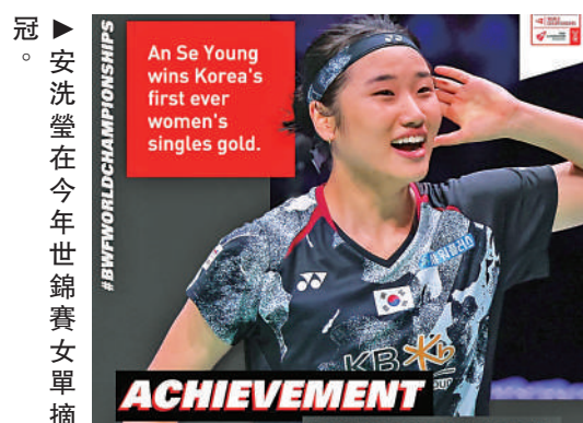
冠 安洗瑩在今年世錦賽女單摘

An Se Young wins Korea's first ever women's singles gold.