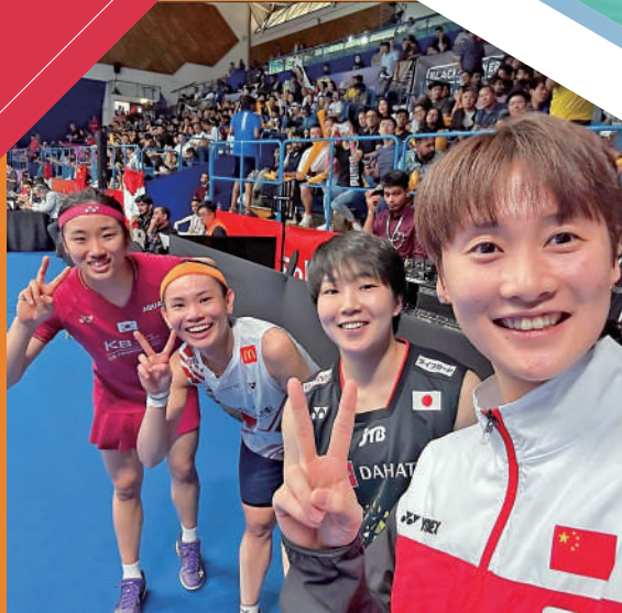
▲世界四位頂尖女羽球選手（右起）陳雨菲、山口茜、戴資穎及安洗瑩。