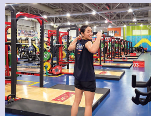
▲安洗瑩有着比肩男選手的步伐能力和水平。

杭州亞運會女單決賽上，安洗瑩在第一局比賽中出現右膝肌腱撕裂問題，這在很大程度上影響了她後場進攻，但她仍然可以憑藉自己穩定、高質量的回球、出色的速度和充沛的體能消耗陳雨菲的體能，直至決勝局陳雨菲因體能不足抽筋後，安洗瑩迅速拿下比賽，比賽始終處於安洗瑩掌控的節奏之中。