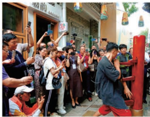
在廣州粵劇藝術博物館，參訪團饒有興致地嘗試粵劇戲服試衣鏡。