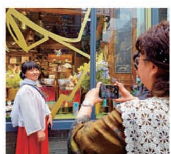
參訪團成員在車廂內，大家熱情地聊天，不少人一聽對方口音就知道對方家鄉來自哪裏。有傳媒高層感慨道：大家鄉音不改，對祖國的情誼不變。

不少海外傳媒高層老總因為疫情原因已經三年未見，重逢時分外親切。他們來自亞洲、歐洲、美洲、大洋洲和