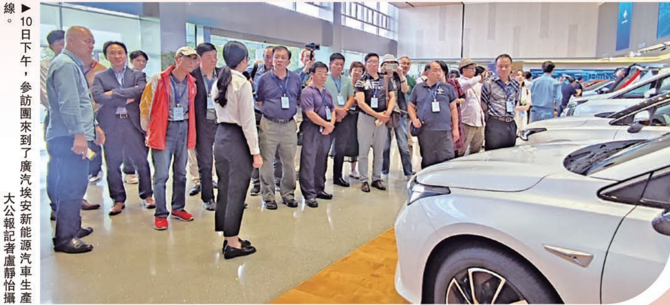
10日下午，參訪團來到了廣汽埃安新能源汽車生產線。