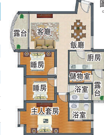
▲城市綠洲花園120平米三房兩廳戶型圖。