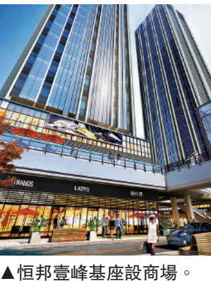
▲恒邦壹峰基座設商場。