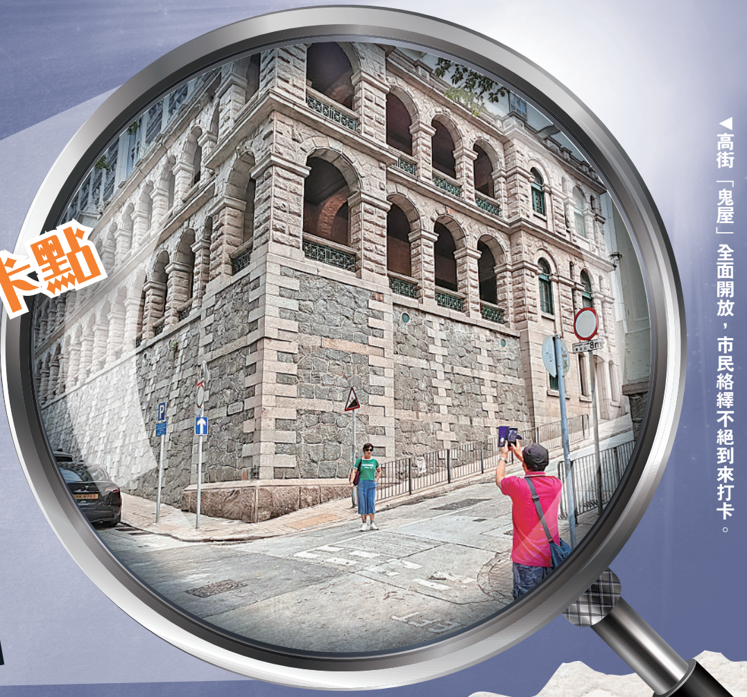
◀高街「鬼屋」全面開放，市民絡繹不絕到來打卡。