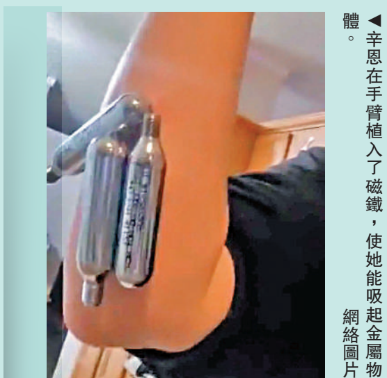
◀辛恩在手臂植入了磁鐵，使她能吸起金屬物。