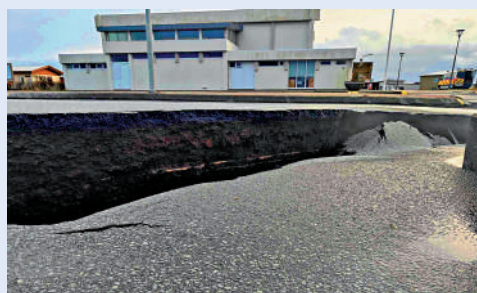
◀冰島格林達維克的路面出現巨大裂縫。

中國駐冰島使館提醒在冰中國公民提高安全意識，盡量避免前往藍色瀉湖和格林達維克及周邊地區；採取必要的安全措施，做好防範地震、火山及其衍生災害的準備；密切關注冰島當地新聞及民防部門發布的有關消息，如遇緊急情況請第一時間報警並聯繫使館尋求協助。