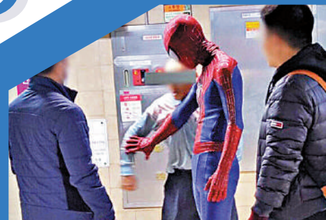
▶視頻截圖顯示，一名身穿蜘蛛俠服裝的男子正在阻止他人施暴。網絡圖片