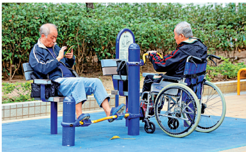
港人愈趨長壽，但需要良好的健康配合，才可享受安樂的晚年。