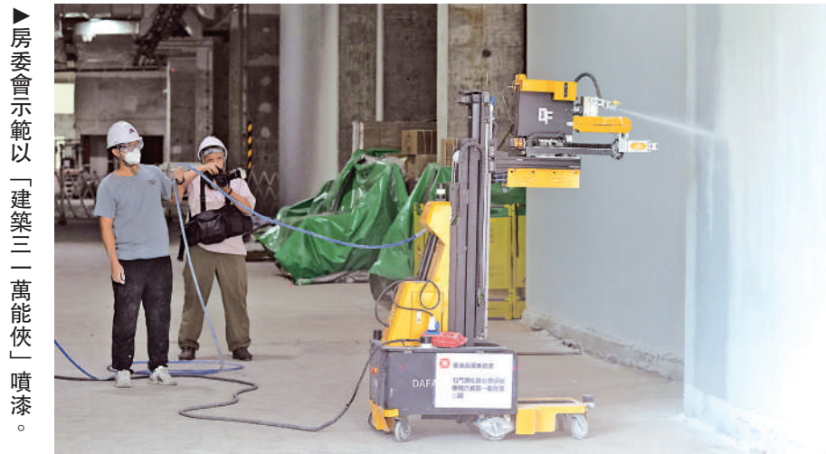
房委會示範以「建築三一萬能俠」噴漆。

鍾嘉麒教授補充：「我們的研究確實顯示香港存在地區層面的社會經濟不平等狀況，意味香港社會目前的行動和努力尚未足以有效並公平地改善影響健康的社會決定因素。總括而言，香港迫切需要採取全面的政策措施，以促進健康老齡化。」