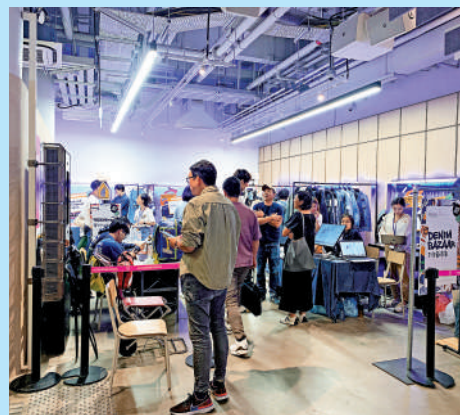
▲牛仔節市集吸引不少人駐足觀看。