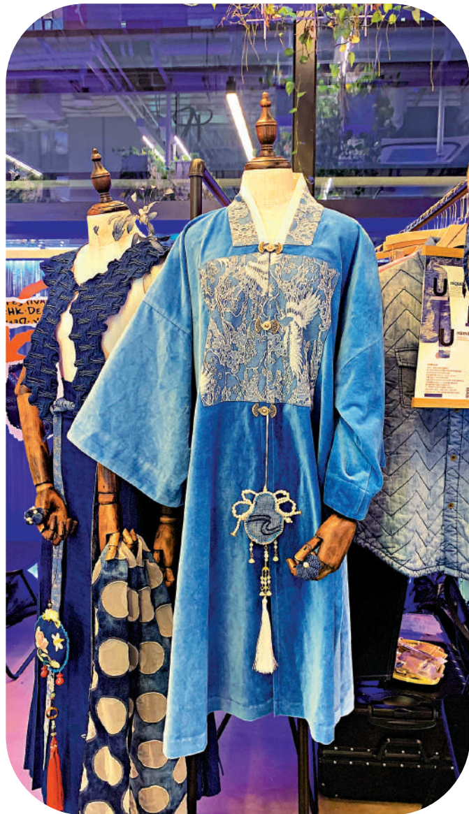
▲牛仔布與中式傳統元素結合的服飾設計。