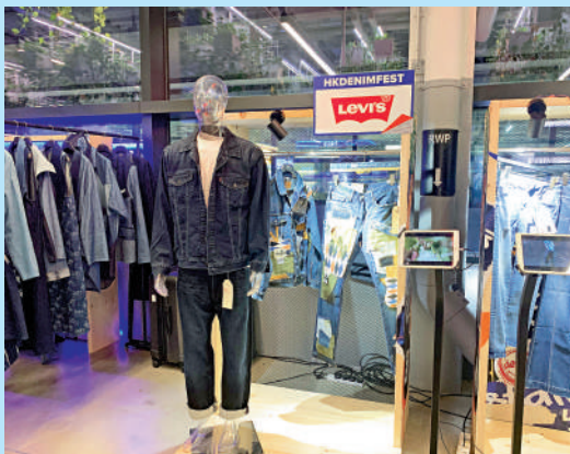
▲中環街市現正展出Levi's等品牌的牛仔單品。

此外，今屆香港牛仔節首次拓寬至大灣區內地城市，部分展品將在佛山展覽，亦會舉辦牛仔節工作坊，以創意促進兩地文化交流。詳情可瀏覽網站： http://www.hkdenimfestival.com