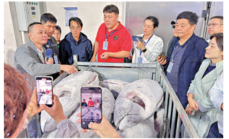
▲見到整條金槍魚，華媒代表紛紛舉起手機記錄。