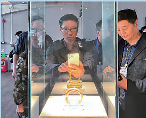
▲海外華媒參訪團成員認真欣賞並拍攝記錄「南海I號」出水文物。