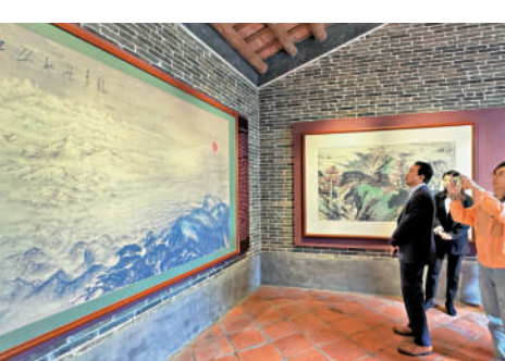
▲參訪團成員在關山月《江山如此多嬌》（複製品）前，了解其背後的創作故事。

「我從小接觸的是江南書畫風格，這次了解到嶺南畫派確實有不一樣的感覺。特別是嶺南畫派融入了鄉村元