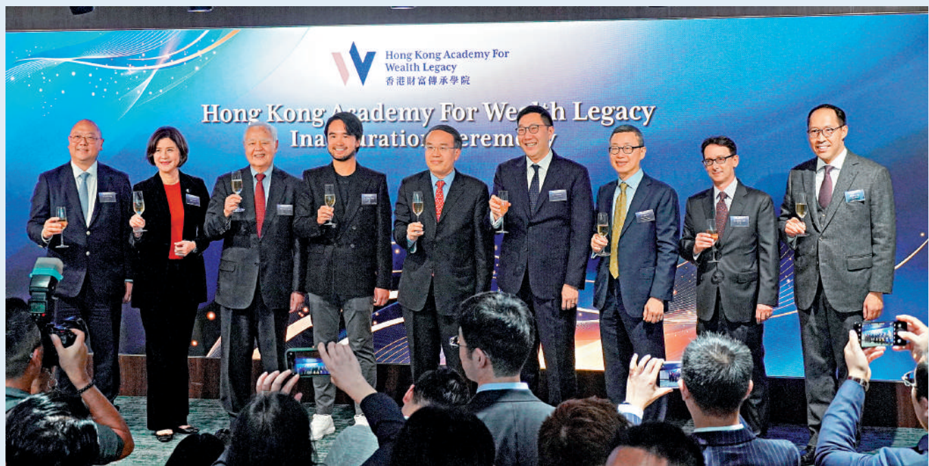
香港財富傳承學院昨日正式成立，以促進香港家族辦公室生態圈的整體可持續發展。