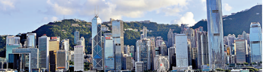
香港家族辦公室稅務寬減條

家族辦公室可以由個人與家族自行成立，或者委託專業機構代辦，在不同國家和地區會對家族辦公室這類公司形態及管理資產有不同的規範、稅務和門檻，部分在投資上有免稅優惠，例如香港家族辦公室稅務寬減條