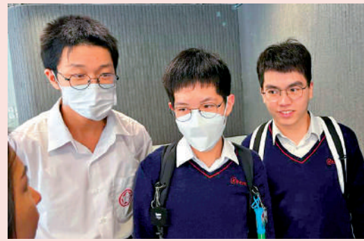
▲中國婦女會中學的顏同學（中）與王同學（左）中標，對回本樂觀。