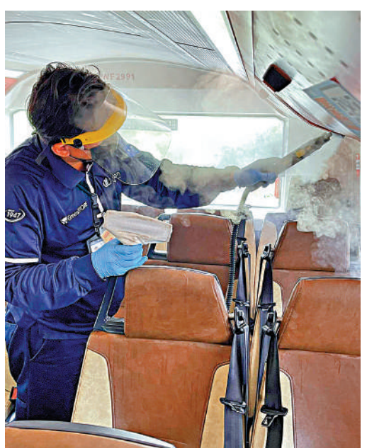
▲九巴得悉事件後，已委託專業公司在該輛巴士車廂進行全面高溫消毒和深層清潔。