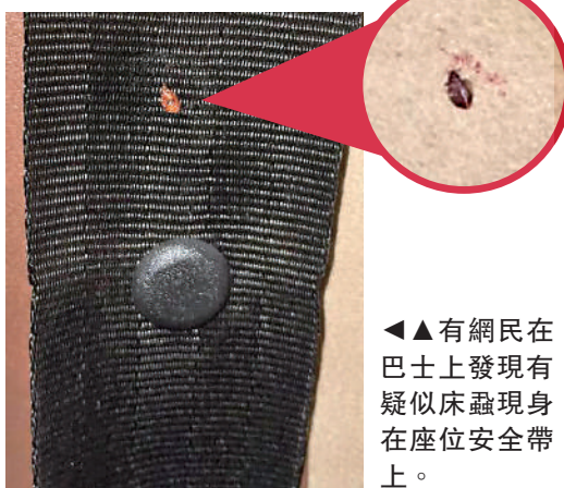
▲有網民在巴士上發現有疑似床蟲現身在座位安全帶上。