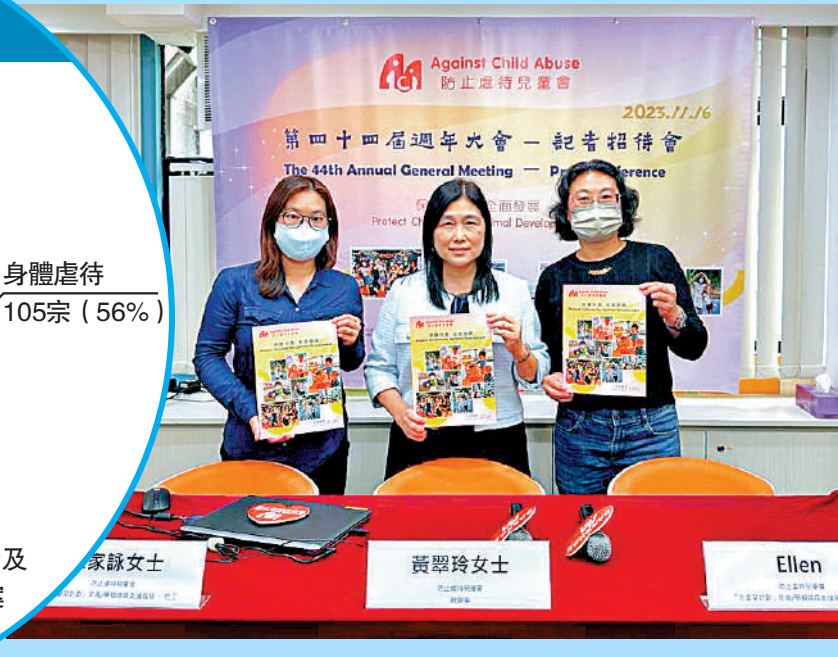
防止虐待兒童會為年輕或單親媽媽提供義工支援服務，照顧孩子。

註：防止虐待兒童會熱線電話及諮詢服務收到的求助或諮詢個案 資料來源：防止虐待兒童會