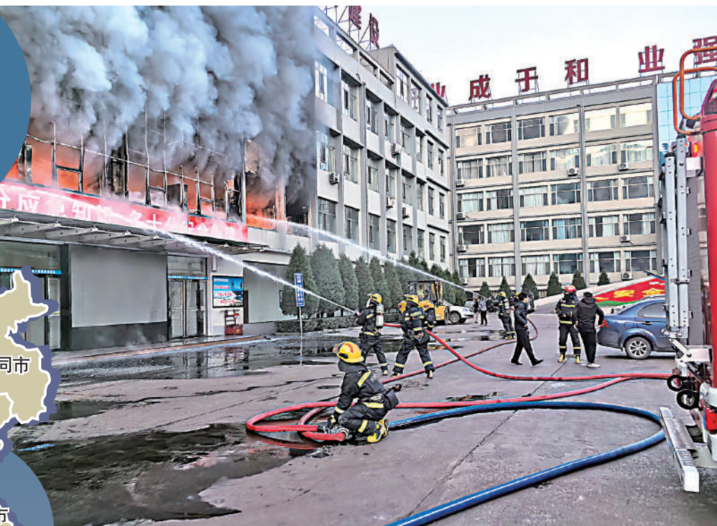
◀16日，山西省呂梁市離石區永聚煤業有限公司地面聯建樓發生火災。圖為火災救援現場。

據當地應急管理部門消息，接到火情報告後，市、區兩級立即啟動應急響應，迅速組織開展救援。現場共投入18輛消防車，30餘輛救護車，醫護人員90餘人，救援人員150餘人進行應急處置救援。截至14時44分，現場火勢已撲滅，搜救工作基本結束；已送往醫院救治64人，其中搶救無效死亡26人，住院治療38人，省市醫療專家組對留院治療人員逐一精準制定救治方案，全力以赴救治傷者。