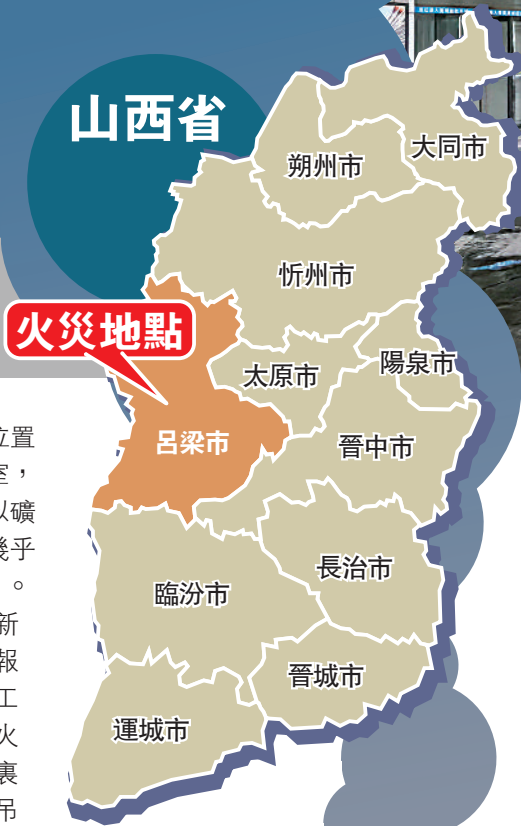
◀山西省呂梁市離石區永聚煤業有限公司地面聯建樓16日發生火災，已致26人遇難。 視頻截圖

【大公報訊】綜合中新社、央視、新京報報道：山西省呂梁市離石區永聚煤業聯建樓16日早晨6時50分左右發生火災，造成重大人員傷亡。事故共造成26人遇難、38人受傷。起火原因有待進一步調查。據說起火點位於二層浴室，而平時則有工人被發現在澡堂吸煙。事故發生後，永聚煤業火災事故多名責任人已被控制，相關責任人正在接受調查。