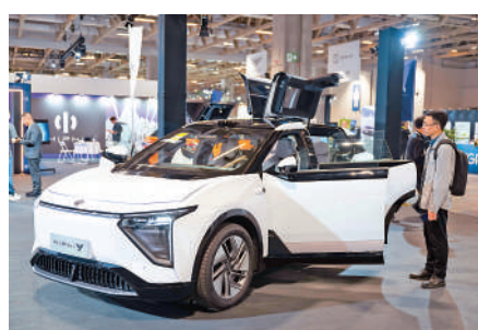
▲2023世界汽車智庫大會暨第十三屆中國國際汽車博覽會近日於澳門舉行，展出多款新能源汽車。

樞及儲能設備研發銷售、新能源乘用車照明系統合作等。有媒體評價，這是兩岸新能源產業合作落地的實際體現。