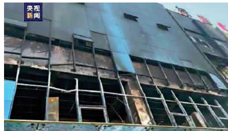
▲發生火災的永聚煤業有限公司地面聯建樓部分位置被燒毀。 網絡圖片

區政府發出通知稱，經研究決定，嚴格按照省、市專項辦級辦理要求，對該網絡輿情反映的東泰集團所屬煤礦9條事故線索全部進行提級核查。工作方案要求的核查重點包括四方面。一是內部核查，根據舉報線索，對時任礦長、安全副礦長、死者所在區（隊）長與班組長、死者工友、人事（勞資或財務）科長等進行談話詢問，了解是否存在舉報反映的生產安全事故。二是外圍調查，根據死者信息，對死者家屬、接診醫院醫生護士、生前鄰居好友等進行談話，了解死者死亡原因。三是技術偵查，協調死者戶籍所在地公安，查找舉報事故發生時間後的1-2月內，死者家屬銀行賬戶是否存在大額資金轉賬或存儲紀錄。四是資料審核，收集離石區核查存檔的相關佐證資料，補充調取相關印證資料，還原事實真相，澄清事情經過，客觀實際完成9條線索的核查上報。