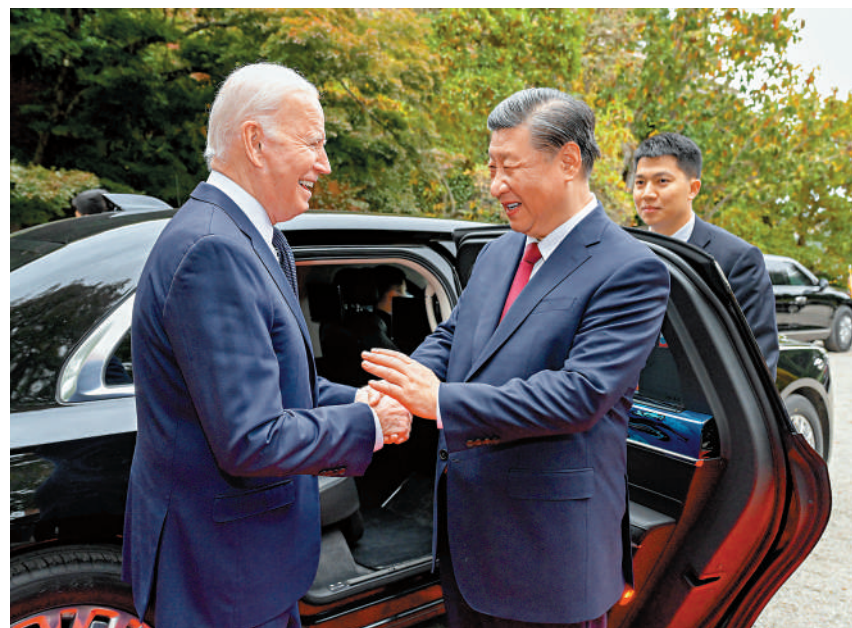
►會談後，拜登邀請習近平一道在斐洛里莊園裏散步，並親自將習近平送到上車處道別。

互相欣賞。這一點，從中美元首會晤的「小插曲」中可以讀得出來，更能從中美長久以來的互動裏品味得出。 中新社