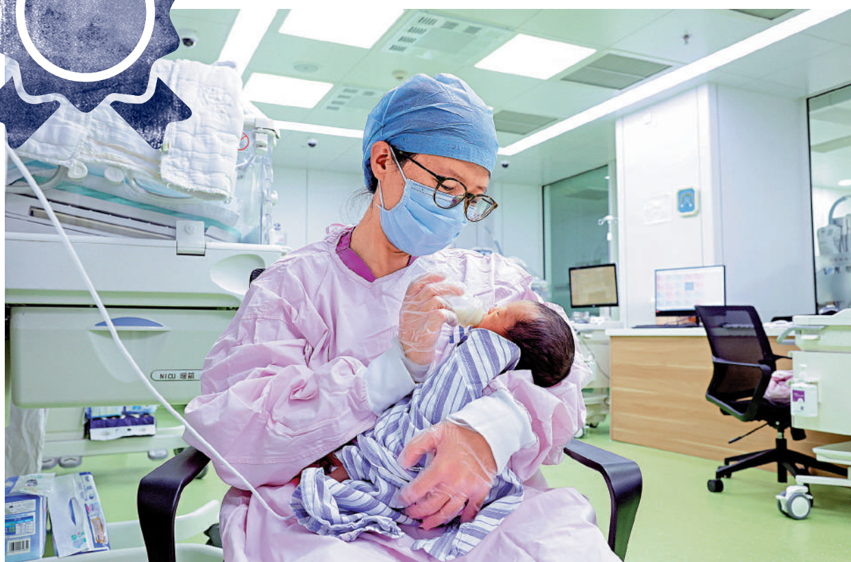
▲國家衛健委明確將嚴厲檢查處理販賣出世紙等問題。圖為新生兒重症監護病房（NICU）護士在為小寶寶餵奶。