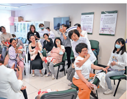
▲在北京協和醫院產科，孕婦與產科醫護人員交流護理技巧。

湖北英山縣衛生健康綜合執法大隊於11月9日成立專項檢查組，到縣人民醫院、縣婦幼保健院開展《出生醫學證明》簽發專項檢查。督查人員主要採取審核出生醫學證明簽發及資料歸檔等方式，重點對《出生醫學證明》組織管理、空白證存儲、首次簽發管理、補換發管理等工作落實情況進行督查，對發現的問題當場提出整改意見，並要求限期整改落實到位。此外，還有陝西白水縣、湖南新田縣、吉林長春市雙陽區、河北保定市競秀區等地開展了《出生醫學證明》管理工作檢查。