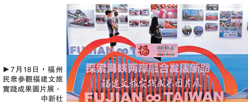
▶7月18日，福州民眾參觀福建文旅實踐成果圖片展。

「我想強調的是，包括中方在內的世界各國採取相應防範和應對措施，維護食品安全和民眾健康，完全是正當、合理、必要的。」毛寧稱，希望日方同中方相向而行，本着建設性態度，通過磋商談判，找到解決福島核污水排海問題的合適途徑。