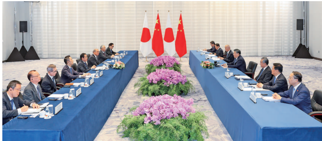
▲國家主席習近平在舊金山會見日本首相岸田文雄，強調中日應該深化合作、互相成就。

【大公報訊】據新華社報道：當地時間11月16日下午，國家主席習近平在舊金山會見日本首相岸田文雄。兩國領導人重申恪守中日四個政治文件的原則和共識，重新確認全面推進戰略互惠關係的兩國關係定位，致力於構建契合新時代要求的建設性、穩定的中日關係。雙方同意，本着建設性態度通過磋商談判找到解決福島核污水排海問題的合適途徑。習近平指出，日本福島核污水排海事關全人類健康、全球海洋環境、國際公共利益。日方應該嚴肅對待國內外合理關切，本着負責任和建設性的態度妥善處理。