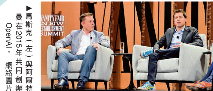
▲馬斯克（左）與阿爾特曼在2015年共同創辦OpenAI。