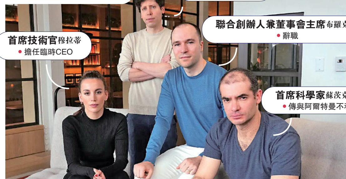
行政總裁阿爾特曼 ●被董事會撤職