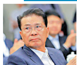
▲美的創始人何享健。