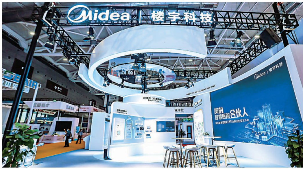
▲美的近年積極發展智能家居業務，並取得良好成果，有助集團的收入及利潤穩定增長。