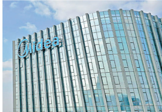
▲美的上月24日正式向港交所遞交招股書。