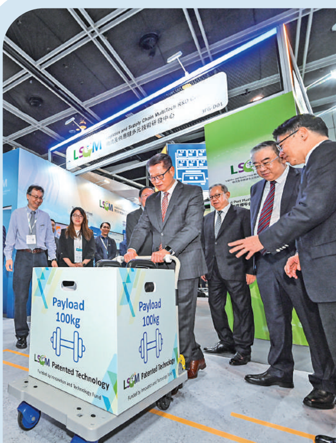
▲陳茂波表示，香港國際機場運力正迅速恢復，今年底料達到疫前80%，明年將會全面恢復。圖為在參觀展覽期間，了解電動助力手推車。

除了專題論壇，「亞洲物流航運及空運會議2023」還舉辦了商業聯繫，讓各行各業能合作共贏。另設有工作坊，幫助相關企業更好應對未來挑戰。