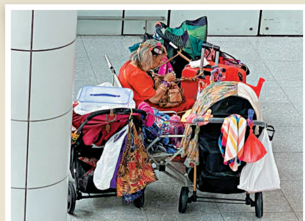
▲花姐的安樂窩位於紅磡站大堂一隅。

政府強調會啟動檢視現行法例，研究如何更有效處理非法出租或取酬載客活動，以及如何規管網約出租汽車平台，加強打擊非法出租或取酬載客。就相關條例草案，政府會爭取盡快在立法會會議恢復二讀辯論，以期早日落實相關措施；針對利用汽車作非法出租或取酬載客用途，當局會繼續加強執法。