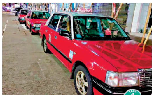
▲的士業界叫停今日的罷工行動。

【大公報訊】記者戴靜文報導：的士業界因為不滿政府取締「白牌車」不力，原計劃於今早發起罷工行動，但在昨日與政府官員會面後，昨晚宣布暫時取消罷工。運輸及物流局發言人表示，政府代表在會面時清晰表明，利用汽車作非法出租或取酬載客屬違法行為，定必嚴厲打擊。政府將就正在審議的條例草案提出