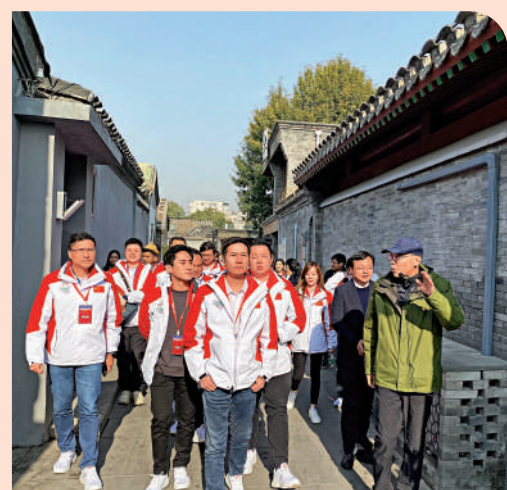
▲交流團走進北京胡同，見識當地基層社區的治理模式。