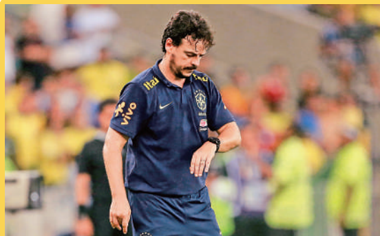
▲巴西主帥甸尼斯未能領軍走出低谷。