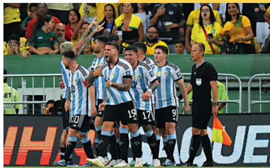
▲阿根廷球員慶祝入球。