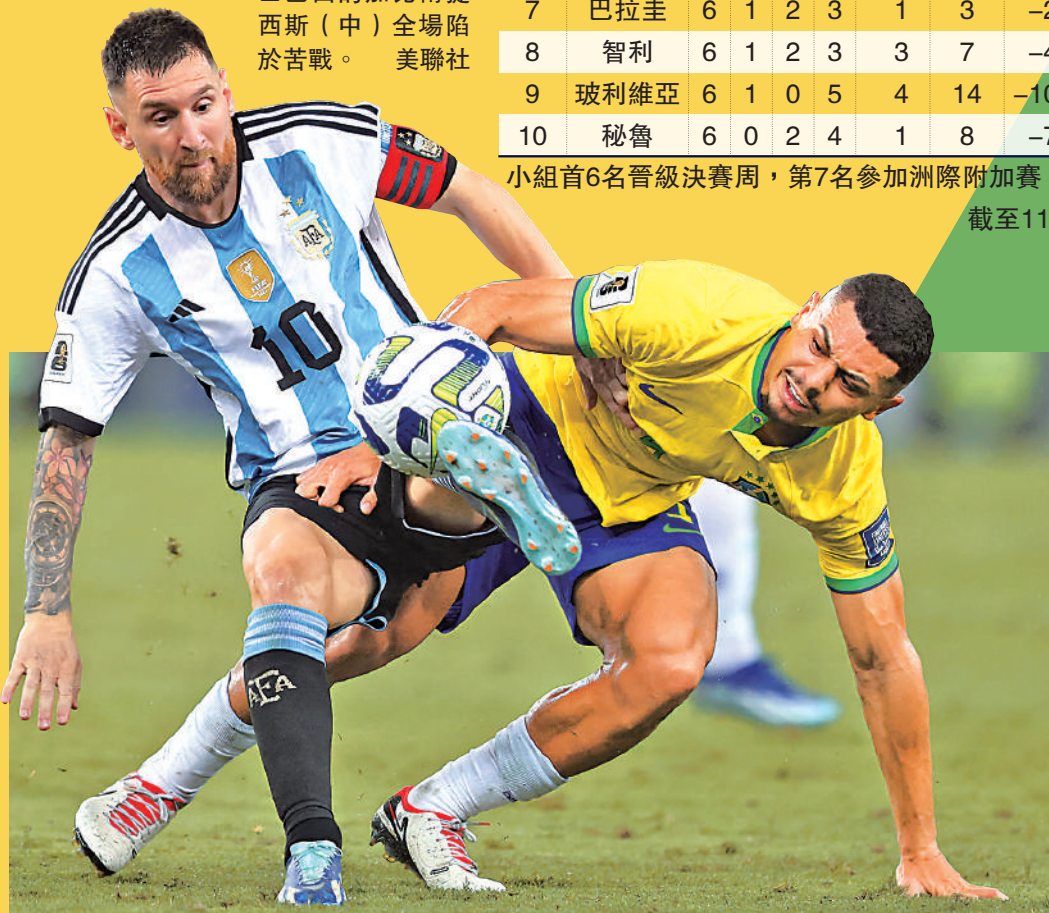
▲美斯（左）與巴西的安迪在比賽中鬥法。