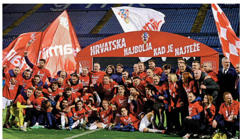
▲克羅地亞球員慶祝晉級歐國盃決賽周。