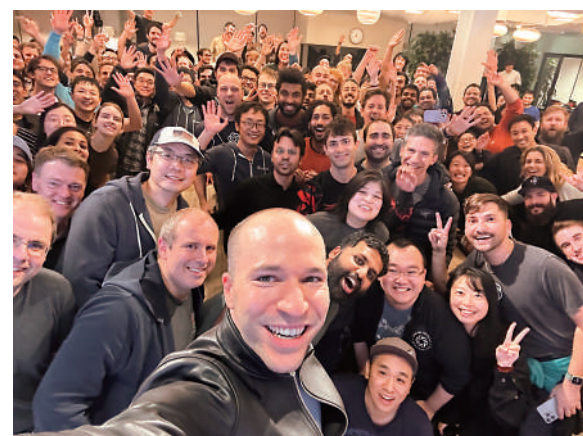
▲布羅克曼22日在社交網站發布員工合影。

此外，外部投資者希望阿爾特曼回歸，主要是希望減少員工的大規模外流，保持公司發展穩定。OpenAI的770名員工中，有超過700人簽署了聯名