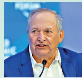
▲美國前財長薩默斯。網絡圖片