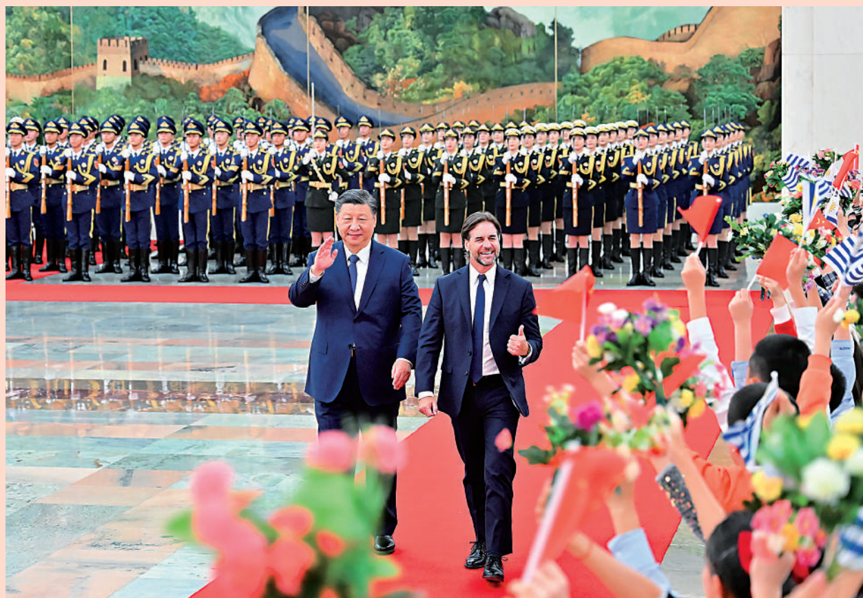
▲11月22日下午，國家主席習近平在北京人民大會堂同來華進行國事訪問的烏拉圭總統拉卡列舉行會談。這是會談前，習近平在人民大會堂北大廳為拉卡列舉行歡迎儀式。

【大公報訊】據新華社報道：11月22日下午，國家主席習近平在人民大會堂同來華進行國事訪問的烏拉圭總統拉卡列舉行會談。兩國元首宣布，將中烏關係提升為全面戰略夥伴關係。習近平指出，中方願同烏方一道，以建立全面戰略夥伴關係為新起點、新坐標，提升雙邊關係水平，豐富兩國合作內涵，將中烏關係打造成為不同體量、不同制度、不同文化國家團結合作的典範。以簽署共建「一帶一路」合作規劃為契機，加強發展戰略對接，培育服務貿易、數字經濟、清潔能源等領域合作新動能，推動中烏共建「一帶一路」進入高質量發展新階段。