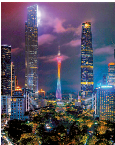
▲劉炬偉拍攝廣州作品《珠江新城夜色》。