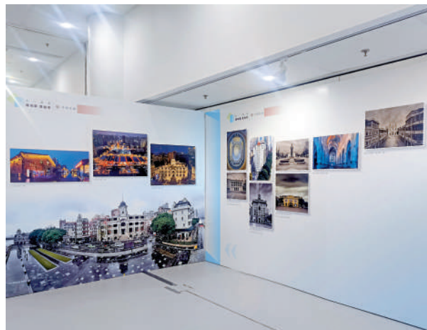
▲攝影展展區一隅。