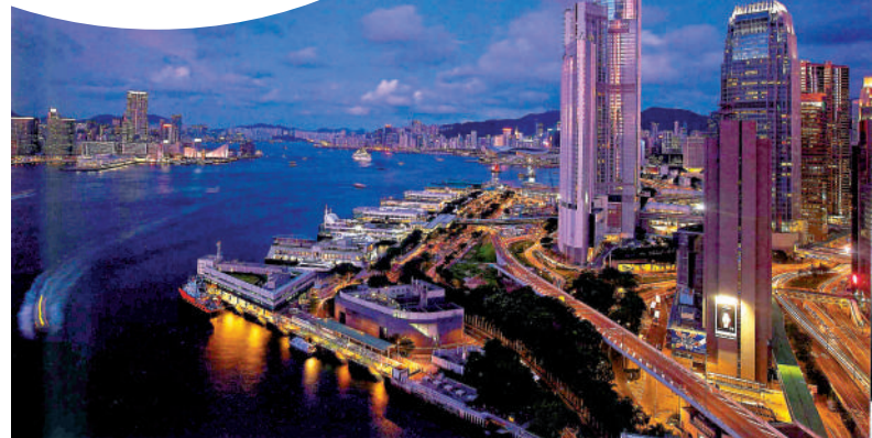
▲隋彪拍攝香港作品《香港國際金融中心》。