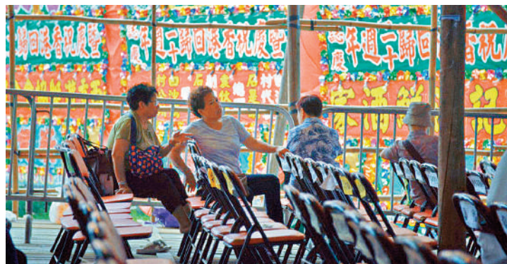
▲在戲棚看戲，氛圍更加原汁原味。資料圖片

他希望現在的人可以通過戲棚看到其背後承載的文化特色，認識到戲棚價值所在，了解它與香港這座城的無限黏連，自然會明白傳承的必要性。