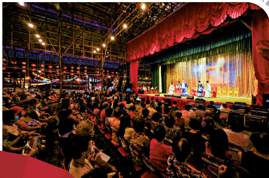
◀戲棚上演粵劇，台下觀眾看得投入。