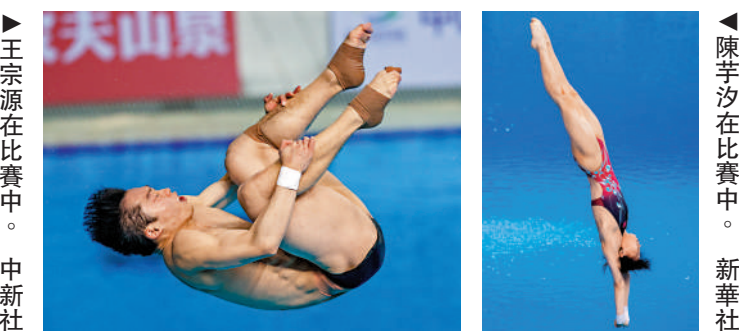
▲王宗源在比賽中。

根據中國游泳協會公布的巴黎奧運選拔辦法，今年3月的全國跳水冠軍賽、本次全國跳水錦標賽及明年2月的多哈世錦賽為3站選拔賽，將取3站比賽中最好的兩站比賽名次計算運動員積分，單人項目積分前四名、雙人項目積分前兩名入選大名單，然後以積分為原則進行綜合評定確定初步參賽名單。