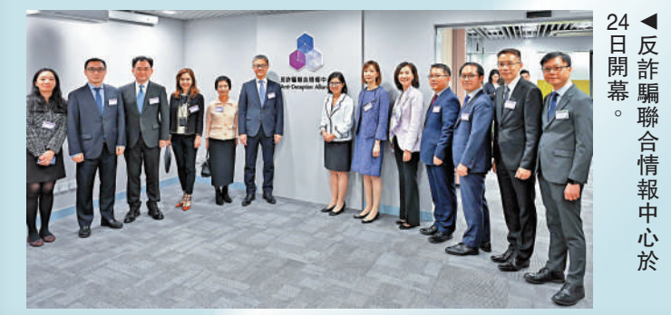
24日開幕。反詐騙聯合情報中心於

蕭澤頤亦提到，警方今年五月初調整入職要求後，警員和見習督察的投考數字有明顯增加，今年五月至十月投考警員和見習督察，分別較去年同期上升64.5%及59.5%，令人非常鼓舞。我們會繼續檢討相關的招募策略，希望更加有效招募到一些卓越、有質素的人加入警隊，服務市民。蕭澤頤亦表示，警方在下月10日舉行的區議會選舉，派出至少兩名警員駐守於各票站，並會在策略性位置加強高調巡邏，以及調派便衣警員視察有無可疑人士，而各警區也會有快速應變部隊處理突發事件。