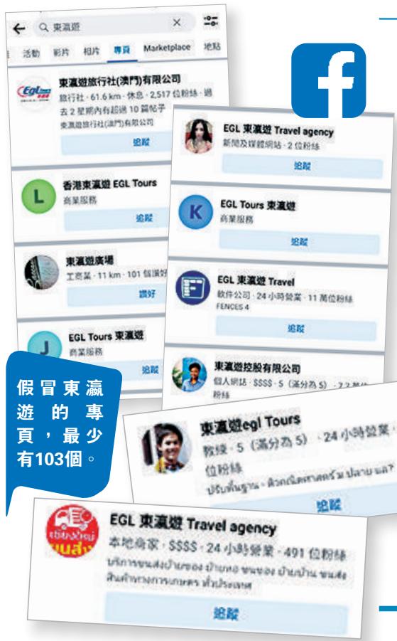
假冒東瀛遊的專頁，最少有103個。

近期Facebook出現多個與「東瀛遊」名稱相似的專頁，均使用「東瀛遊」的官方標誌作為圖像。有帖文聲稱可以用3000多元，購買前往泰國曼谷的聖誕自由套票，包含來回機票及四晚酒店住宿，又聲稱旅遊服務是由東瀛遊提供。大公報記者發現，「東瀛遊」已獲得「藍標」官方驗證徽章，未見假冒「東瀛遊」的專頁，相信已被刪除。