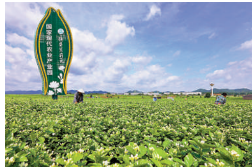
▲廣西橫縣是世界茉莉花都，享有「全球每10朵茉莉花，6朵產自橫縣」的美譽。