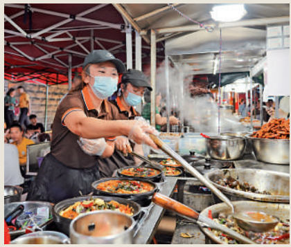
▲廣西美景美食眾多。圖為廣西柳州夜市上，攤主正在製作廣西特色小吃螺螄鴨腳煲。

「目前南寧至廣州、深圳高鐵運行時間分別約2小時42分、3小時25分；深南高鐵建成後最快將分別只需約2小時、2.5小時，均省時四分之一左右。」廣東省交通運輸廳有關負責人表示，深圳至江門段建成投用後，香港將新增通往粵西地區的「高鐵新走廊」，亦有利於打通珠江兩岸聯繫，打造「灣區半小時經濟圈」。