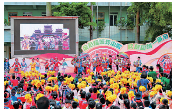
▲廣西打造「壯族三月三」盛會展現民族文化魅力。圖為民眾參加唱山歌活動。