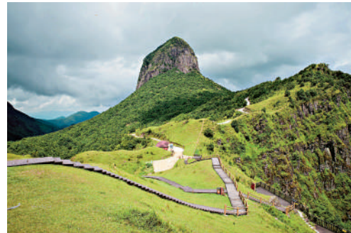
▲景區內有高山湖泊、溝壑峽谷、溪谷瀑布群，還有海拔1000米之上的高山草甸。