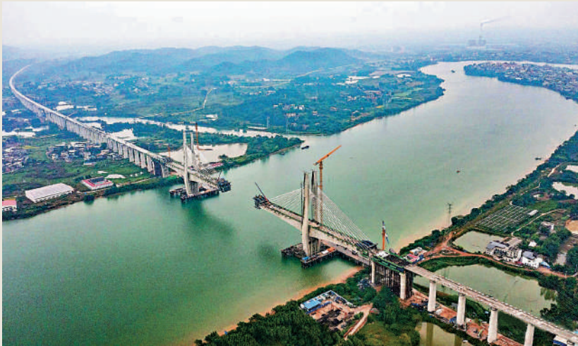
▲上月，南深高鐵南玉段控制性工程——六景郁江特大桥首節鋼箱樑成功安裝。

據最新規劃，新建「深南高鐵」西起南寧東站，東至深圳北站，全長約660公里，其中新建南寧至江門段約544公里，利用在建深圳至江門高鐵約116公里。