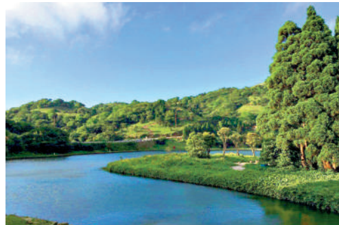
▲大容山是桂東南第一高峰，最具特色的是在蓮花山一帶形成「南北歐風情」景觀。