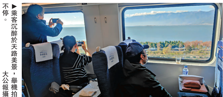
▶乘客沉醉於天路美景，舉機拍不停。

麗香鐵路是滇藏鐵路的重要組成部分，時速140公里，全長139.7公里，投資107億元，貫通麗江市和迪慶州，使昆明至香格里拉的通行時間由原來公路運輸的6.5小時縮短到最快4.5小時。