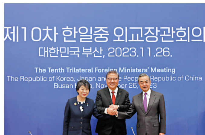
▲當地時間11月26日，中共中央政治局委員、外交部長王毅在韓國釜山同韓國外長朴振、日本外相上川陽子共同出席第十次中日韓外長會。

三方就共同關心的國際和地區問題交換意見。王毅指出，中日韓要當好維護地區和平安全的「穩定器」，踐行共同、綜合、合作、可持續安全觀，堅持通過對話協商、以和平方式解決分歧和爭端。要當好解決熱點問題的「減壓閥」。朝鮮半島局勢持續緊張不符合任何一方利益，當務之急是給形勢降溫，為重啟對話創造必要條件，為此採取有意義行動。