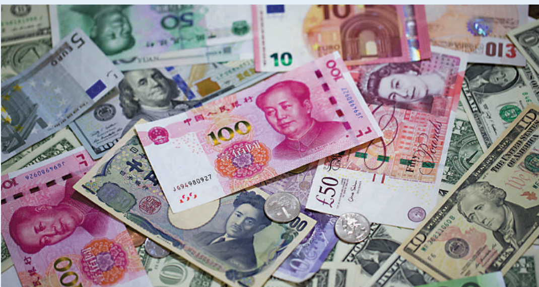
▲人民幣在國際儲備貨幣地位、國際結算份額佔比，以及金融市場的影響力等仍有提升空間。

當前正值國家「十四五」規劃實施的中期檢討階段，明年更將進入「十五五」規劃的前期研究準備階段。筆者建議，特首政策組需要組織相關研究力量，對本港在「十五五」階段的經濟社會問題展開深入的研究準備工作；在充分諮詢社會各界的意見下，結合香港的經濟產業基礎、在國際上以及國家的獨特優勢和定位，以國際化的視野和創新思維，着手編製第一個「五年規劃」，甚至可嘗試就解決一些深層次矛盾制定專項的規劃文件，從而更好發揮「一國兩制」的制度優勢，推動本港經濟邁上高質量發展。這類研究，亦有助增強商界及外資對投資香港的信心，是值得開展的。