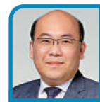
顯世華章 周文港 立法會議員、 全國港澳研究會理事

澳門自回歸祖國以來，維持長時間經濟快速增長，與此同時一些經濟深層次問題也逐漸顯現出來，突出表現在博彩業「一業獨大」日趨突顯，經濟結構單一化長期為人所詬病。雖然澳門特區政府一早明確支持拓展產業適度多元化，社會上亦不乏支持的聲音，但從過去10多年的實際變化來看，相關工作取得了一些積極進展，但總體而言仍有進步空間。2020年新冠疫情來襲，導致進入澳門的遊客數量呈斷崖式的下跌，對當地博彩業及旅遊相關行業造成了史無前例的打擊。2020年澳門的博彩業收益按年下跌約八成，拖累澳門經濟總量大幅萎縮約五成半，在隨後兩年澳門經濟仍受負面影響，本地生產總值（GDP）總量距離疫情前仍相差甚遠。