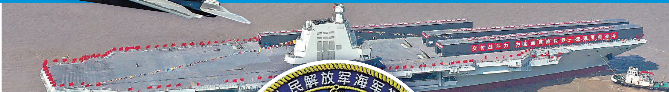
▲福建艦去年6月下水時，三條電磁彈射器均蓋有工棚，而目前三處工棚均已拆除。