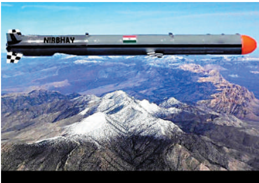
▲「無畏」巡航導彈此前的測試畫面。

今年5月，印度組建「綜合火箭部隊」，主要管理常規導彈，包括「無畏」「布拉莫斯」等巡航導彈。印度11月21日和22日在海軍導彈驅逐艦「因帕爾」號上，成功試射了增程型「布拉莫斯」超音速巡航導彈。「布拉莫斯」是一型中程導彈，有陸基、空基、海基、潛射多種發射方式，用於陸攻和反艦作戰，最大射程約500公里。