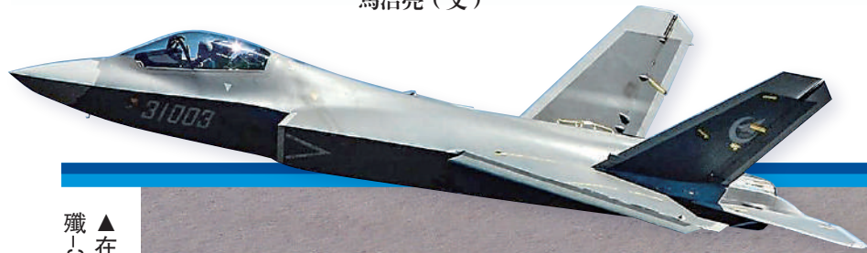
▲在中國國產戰機「鷲鷹」FC-31基礎上研發的殲-35，將成為福建艦艦載機。圖為FC-31。