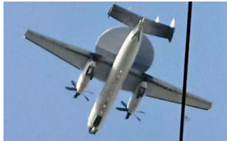
▲空警-600機背的雷達罩以半圓對稱布局呈現出兩種不同顏色。

空警-600綽號「海盤子」，與陸基空警-2000、空警-500外觀類似，都在機背安裝圓形雷達罩。但後二者都採用三面陣有源相控陣天線實現360度全向視野。艦載型空警-600由於機型相對較小，雷達罩內安裝了一塊S波段和一塊UHF波段雷達，通過機械轉動裝置來保