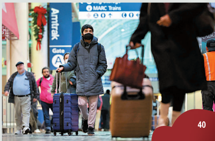
▲美國華盛頓特區的旅客22日走在聯合車站內。