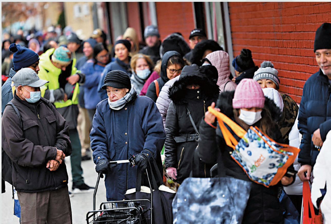
▲感恩節恐讓美國迎來新一波病例上升。圖為民眾21日在紐約排隊等候火雞派送。

哈佛大學陳曾熙公共衛生學院的免疫學家和傳染病專家赫萊爾表示，「急診室擠滿了咳嗽和打噴嚏的患者，這會造成社會負擔」，何況現在並不止一種病毒在傳播。醫生和藥房變得更加忙碌，準備為人們注射疫苗。十月底的數據顯示，美國本季新冠疫苗接種進展緩慢。雖然本季有一種新藥針對嬰兒免受RSV感染，但因需求高而供應短缺。醫生也敦促人們盡快接種疫苗，有助於遏制感染速度。