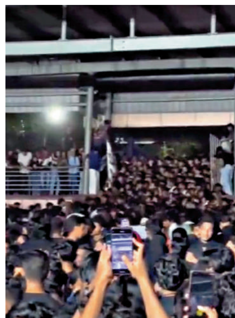
▲印度出事音樂會的相關影片截圖顯示，現場人頭攢動。

印度最嚴重的踩踏事件之一發生於2013年，中央邦的拉坦加神廟踩踏事件造成至少115人死亡。當時是印度教節慶，大批民眾在過橋朝拜期間在橋上發生推擠踩踏，還有人被擠下橋墜河身亡。