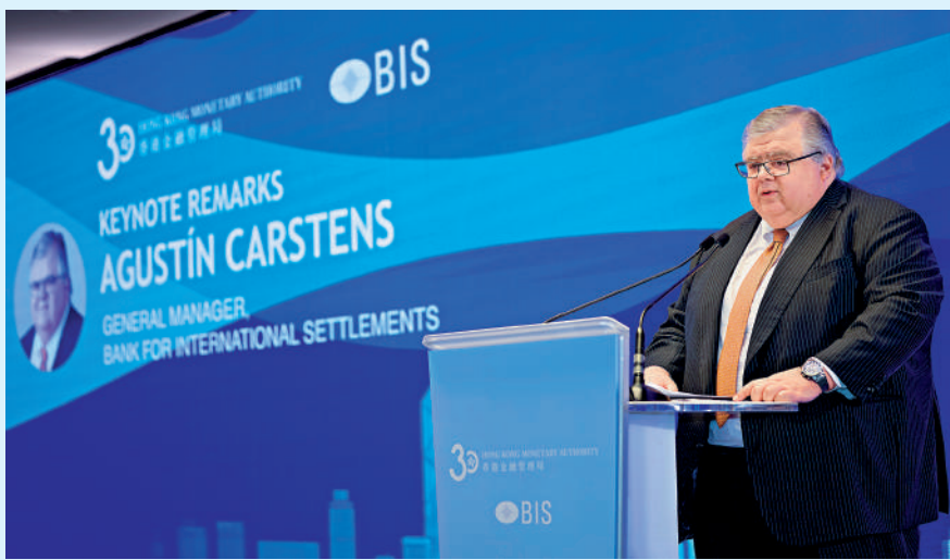
▲Agustín Carstens指出，亞洲經濟增長迅速，在全球經濟中的佔比已增加至超過45%。