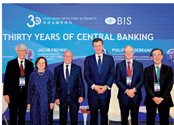
▲白川方明（右一）認為，除非金融穩定性受到影響，否則不必太過擔心輕微通縮帶來的問題。

關於市場前景，澳洲儲備銀行前任行長Philip Lowe認為，在氣候變化、能源問題、地緣政治衝突下，供應和需求出現變化，未來幾年將面對更嚴峻的挑戰。他強調，央行必須為市場注入信心，讓他們相信通脹可以迅速受控，「否則下次危機來臨時便不會有人信任你！」