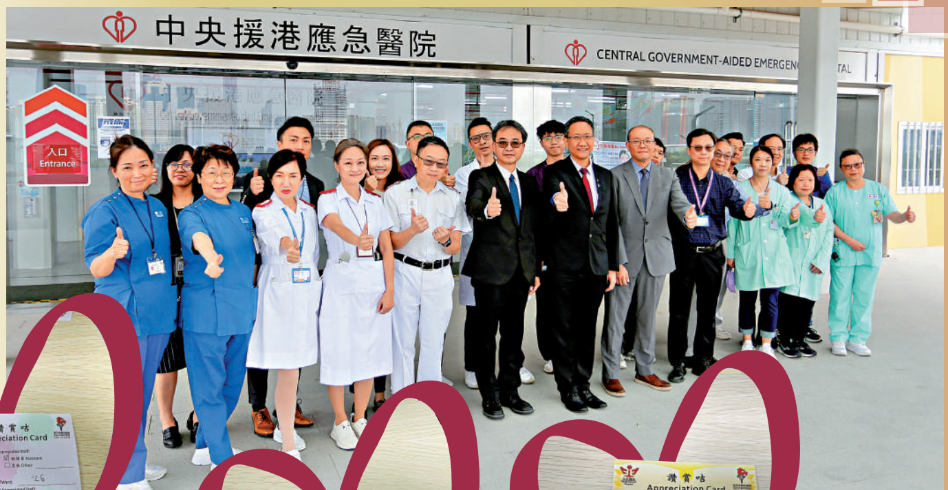
◀病人為應急醫院的醫護人員寫讚賞咭，表揚他們的認真工作。

中央援港應急醫院於去年3月動工，51日落成，2022年12月30日移交特區政府，特區政府安排醫管局接管醫院。醫管局新界東醫院聯網把握契機，善用應急醫院設施開展多項服務，以配合公營醫療服務需求。