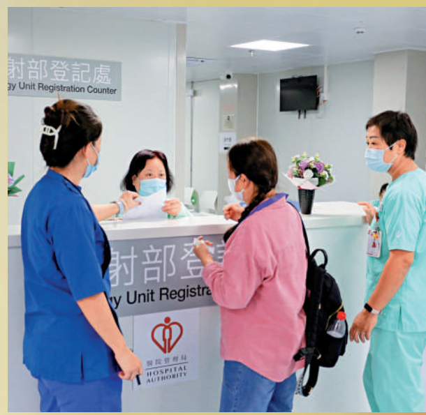
▲應急醫院提供放射診斷檢查等服務，近萬病人獲得加快斷症。