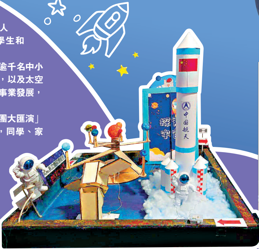
學生製作的中國航天科技模型，維妙維肖，十分逼真。