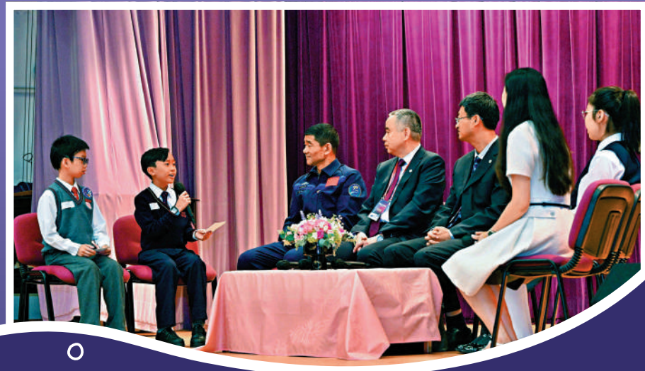
馬頭涌官立小學（紅磡灣）的學生向劉伯明和航天團成員發問。