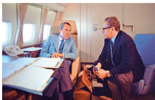
▲1972年，時任美國總統尼克松（左）和基辛格踏上訪華之旅。 資料圖片