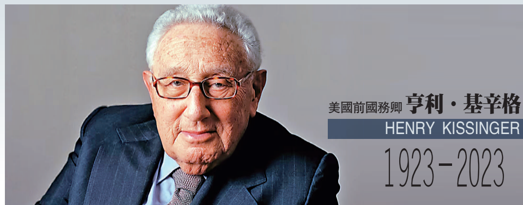
美國前國務卿 亨利·基辛格 HENRY KISSINGER 1923-2023

10月7日巴以衝突爆發後不久，德國首都柏林有阿拉伯人慶祝巴勒斯坦伊斯蘭抵抗運動（哈馬斯）突襲以色列。曾以猶太難民身份從納粹德國逃到美國的基辛格稱，這種情況「令人痛苦」。他說，哈馬斯必須受到「一些懲罰」，並警告稱，中東衝突有升級風險，哈馬斯及其支持者的真實目的是動員阿拉伯世界反對以色列。他認為，俄烏衝突和巴以衝突都是「對國際體系的根本性打擊」。